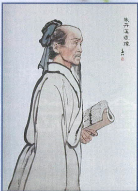
朱丹溪曾說過「有諸內者，必形諸外」。